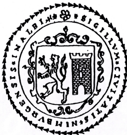
Příloha č. 5: Suchá městská pečeť