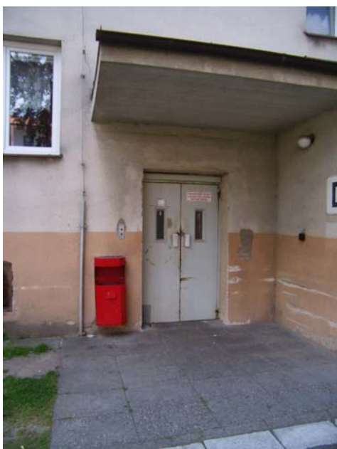
nástupní stanice na dvoře (-1)