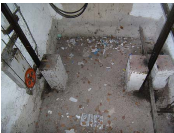
prohlubeň šachty výtahu s betonovými dosedy