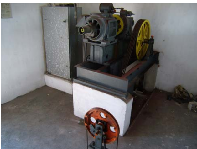
osazení původní strojovny – stroj, rozvaděč, OR