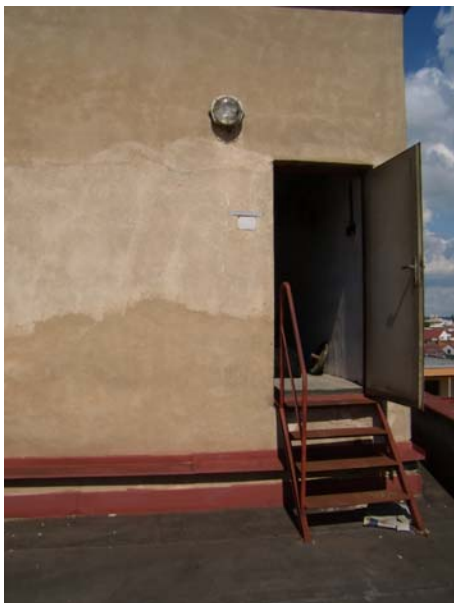
vstuo do strojovny ze střechy budovy