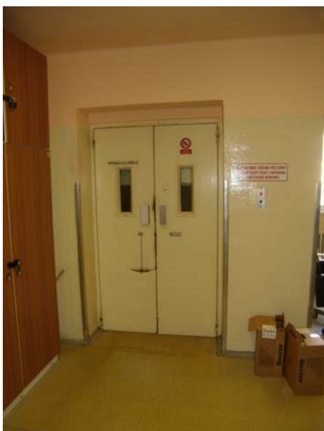
původní šachetní dveře uvnitř budovy