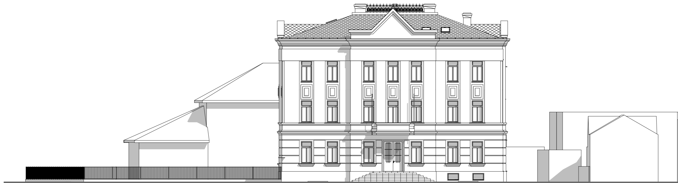
Pohled západní - stávající stav