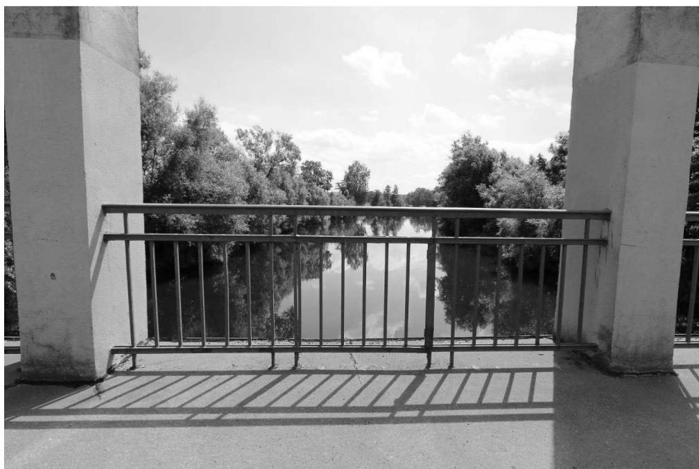
Barva zábradlí RAL 210 40 30