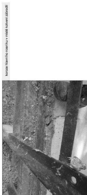
korze hlavního nosníku v místě kolenního zabudování