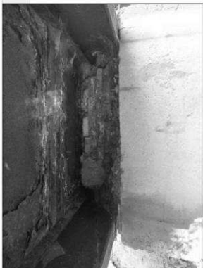
podání rozpad zdiva podporového příčniku, korozí OK NK