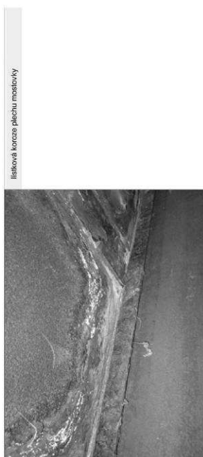
listová korze plechu nosníky