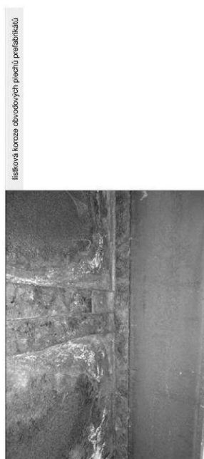
listová korze obvodových plechů přelázníků