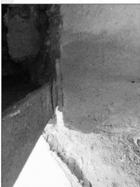
uložení NK na opěru