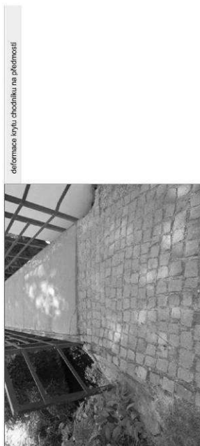
deformace kryty chodníku na předmostí