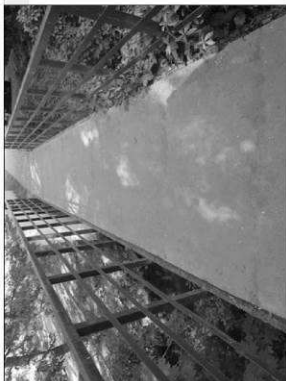
příčné uspořádání na lávce